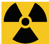
Σχήμα 4 : Διεθνές σύμβολο μολυσματικού και ραδιενεργού χαρακτήρα

Τα κατάλληλα αποθηκευτικά μέσα θα πρέπει να είναι διαθέσιμα στα αντίστοιχα σημεία παραγωγής των αποβλήτων. Ειδικές οδηγίες που αφορούν την κατηγοριοποίηση, διαλογή και πλήρωση των αποθηκευτικών μέσων θα πρέπει να είναι αναρτημένες σε όλα τα σημεία παραγωγής και συλλογής των αποβλήτων.