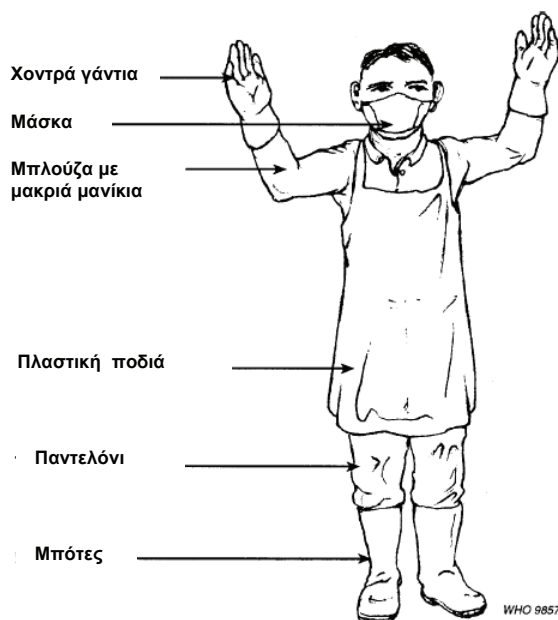
Σχήμα 5: Συνιστώμενη ενδυμασία κατά τη μεταφορά ΕΑΥΜ

Παρακάτω παρουσιάζεται η συνιστώμενη ενδυμασία κατά τη μεταφορά ΕΑΥΜ.